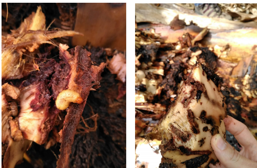
Figura 1. Larva (izquierda) y adulto (derecha) de C. sordidus en cormos de platanera.

El picudo negro de la platanera Cosmopolites sordidus afecta al cultivo de la platanera en Canarias, encontrándose en las islas de Tenerife, La Gomera y La Palma, donde se la considera como la plaga principal (Perera y Molina, 2002). Es un curculiónido de 9-16 mm de longitud, cuyas larvas se alimentan de la cabeza o cormo de la planta excavando galerías y destruyendo tejidos y vasos (Fig. 1). Esto provoca un debilitamiento general de la planta con amarillos foliares, falta de desarrollo y problemas en el “llenado” de la fruta que pueden afectar gravemente a la producción (Perera et al., 2011).