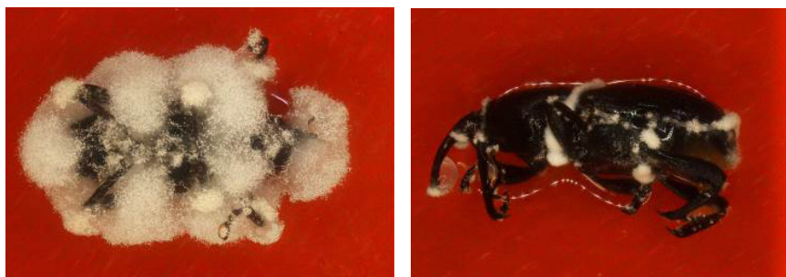
Figura 3. Aspecto del micelio de B. bassiana sobre adultos de C. sordidus .

Las placas se sellaban con Parafilm® y se incubaban durante un período máximo de 14 días a 25\pm 1^{\circ}\text{C} , 60% HR, y en oscuridad, observándose periódicamente para mantener la humedad del papel de filtro y registrar a los insectos que presentaban crecimiento del micelio blanco característico de B. bassiana desde el interior de su cuerpo (Fig. 3). Para calcular la mortalidad de picudos en cada tratamiento sólo se consideraron aquellos con presencia de micelio